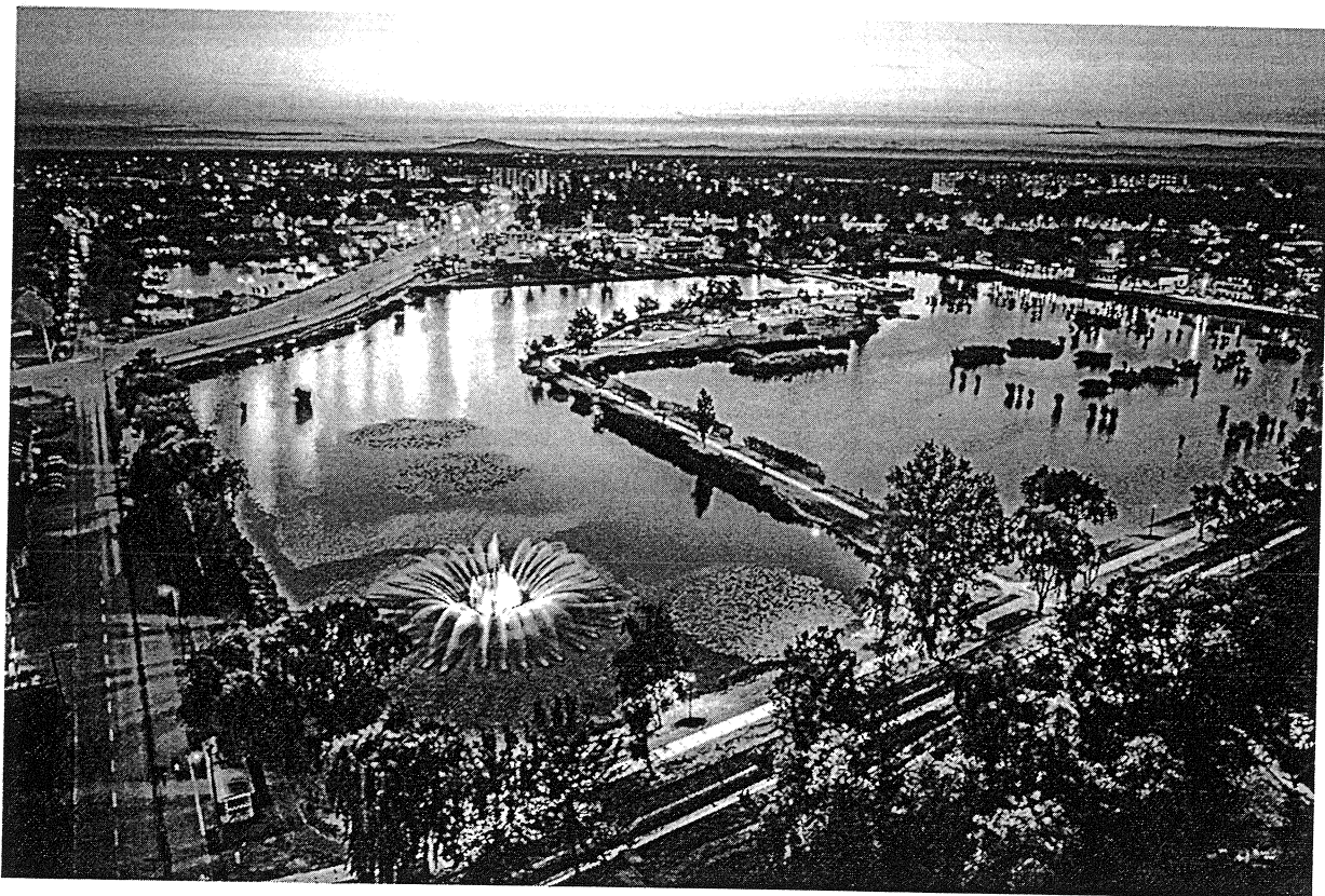
Bujtosi tó esti fényben napjainkban 1.