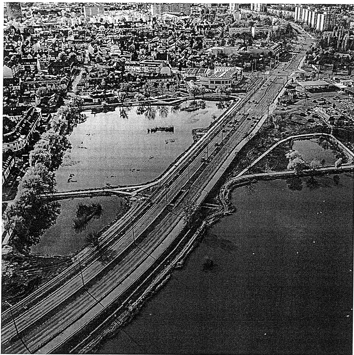
Bujtosi tó nappali fényben mostanában 1.