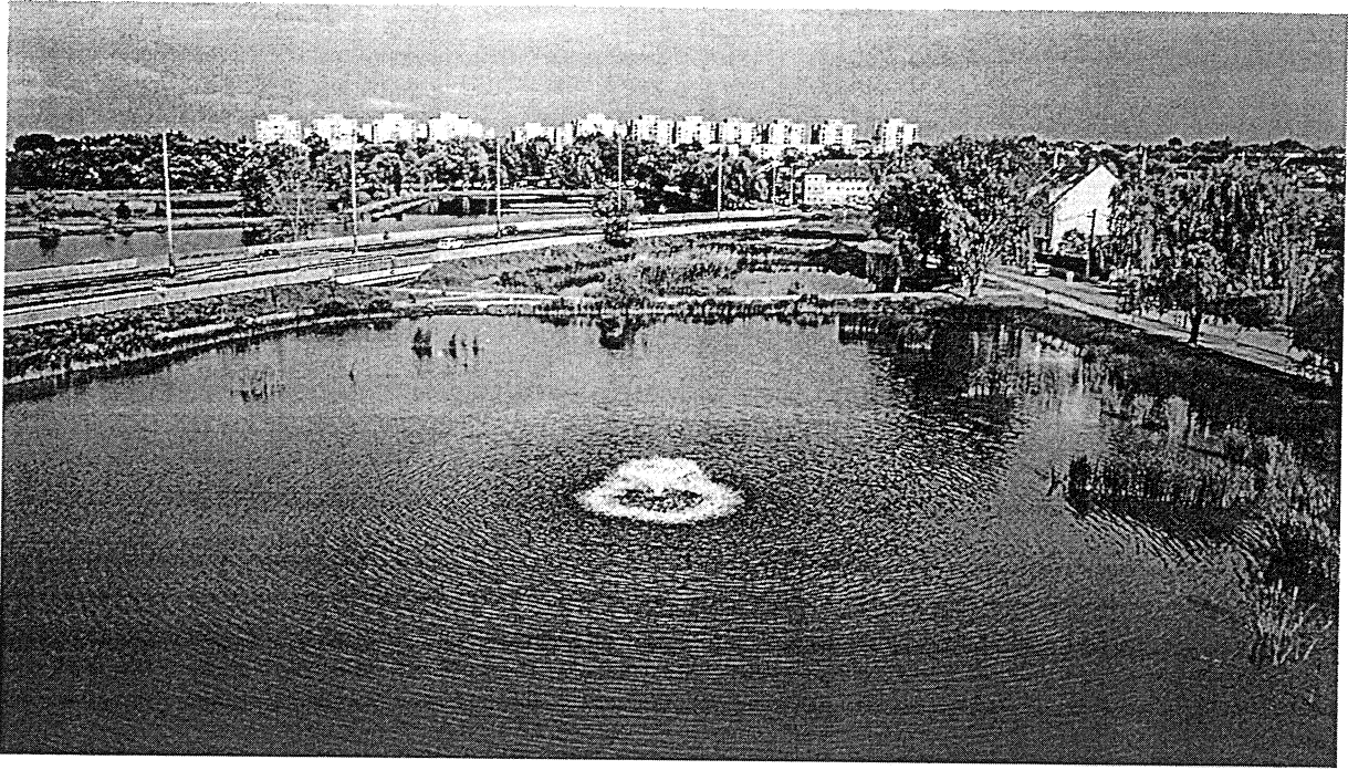
Bujtosi tó nappali fényben mostanában 2.